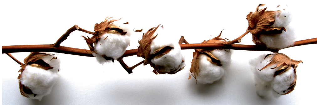
Κλαδί βαμβακιού σε φυσική μορφή.

με το δοξάρι, για να γίνει πιο αφράτο· αυτή η δουλειά αντιστοιχεί στο ξάσιμο και το λανάρισμα των μαλλιών και γίνεται από όλη την οικογένεια.