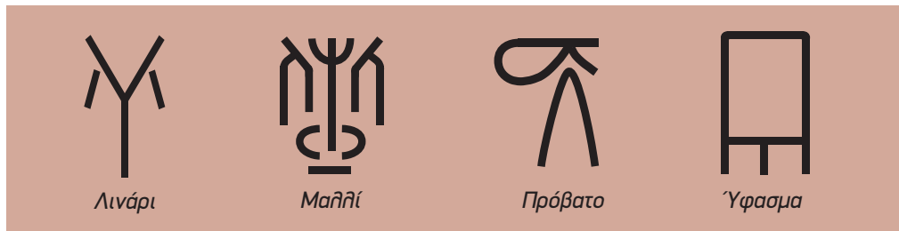
Σύμβολα της Γραμμικής Β.

γλώσσας, αναφέρουν το λινάρι και το μαλλί. Από τα στοιχεία αυτά συμπεραίνουμε ότι το λινάρι χρησιμοποιήθηκε στη Νεολιθική εποχή και το μαλλί στην Εποχή του Χαλκού, ενώ μια άποψη θεωρεί πιθανό ότι ήδη τότε ήταν γνωστό και το μετάξι. Σε ορισμένα μουσεία έχουν αναπαραστήσει πώς ήταν οι αργαλείοι της Νεολιθικής εποχής.