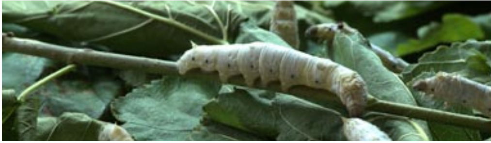
Μεταξοσκώληκας καταναλώνει μουρόφυλλα.

του στρώνουν, υφαίνει το κουκούλι, μέσα στο οποίο μεταμορφώνεται σταδιακά σε πεταλούδα. Επτά ημέρες αφού μαζέψουν τα κουκούλια από τα κηλαδιά (ξεκλάδωμα), «ψήνουν» τα κουκούλια σε ατμό, και οι χρυσαηλίδες θανατώνονται. Από αυτά τα κουκούλια, τα οποία αναπνίζονται, δηλαδή ξετυλιγούνται με τη βοήθεια απλών εργαλείων, βγαίνει το καλύτερο μετάξι. Διαφορετικά,