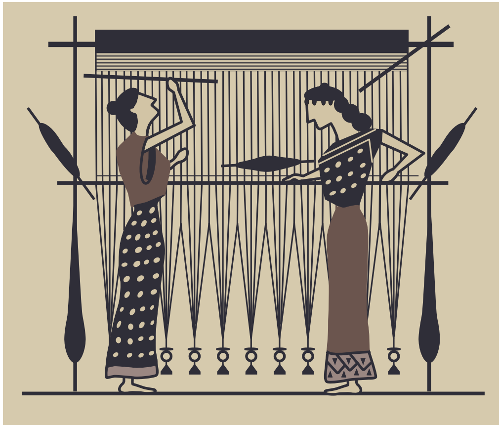
Παράσταση όρθιου αργαλειού από αρχαίο αγγείο. Σχεδιαστική απόδοση: Ιουλίτσα Καραβασιλόγλου.

Στην αρχαία Ελλάδα, ο αργαλειός ήταν όρθιος: οι γυναίκες ύφαιναν περπατώντας από τη μια άκρη στην άλλη. Ο χιτώνας και το ιμάτιο, τα ρούχα