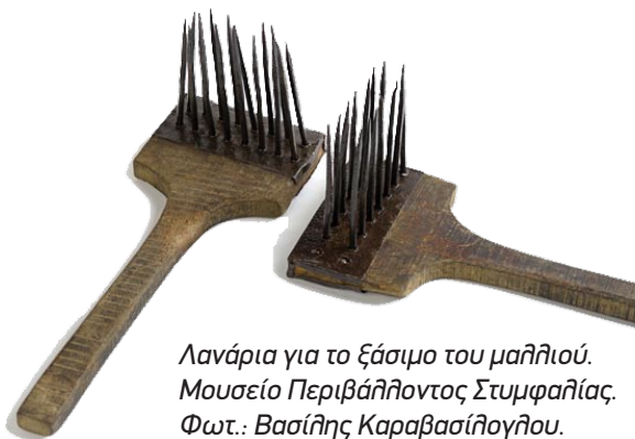
Λανάρια για το ξάσιμο του μαλλιού. Μουσείο Περιβάλλοντος Στυμφαλίας.

Μετά το λαναρίζουν (το χτενίζουν), με μεταλλικές χτένες (λανάρια), για να γίνει πιο μαλακό. Έπειτα σχηματίζουν τούφες (τουλούπες) και το γνέθουν (το στρίβουν) στη ρόκα, για να γίνει κλωστή.