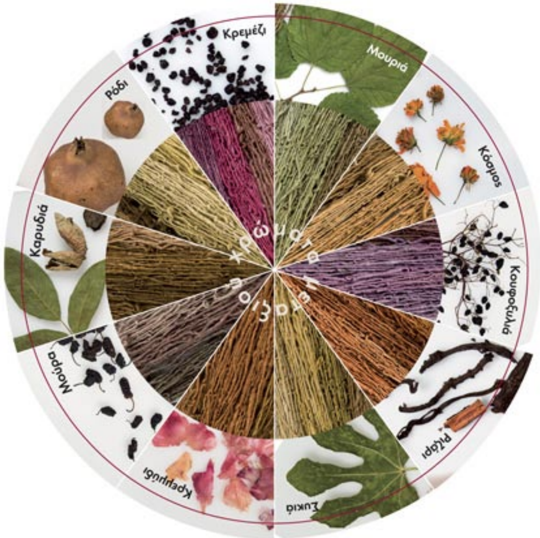
Οι πρώτες ύλες και το αντίστοιχο χρωματικό αποτέλεσμα. Σχεδιασμός: Ιουλία Καραβασίλογλου.

Η υφάντρα ή η κεντήστρα παρασκεύαζε τα χρώματα από τα φύλλα, τη ρίζα, τον καρπό ή τη φλούδα δέντρων και φυτών του τόπου της, σύμφωνα με παραδοτέρες συνταγές. Τα χρώματα αυτά συνδυάζονταν αρμονικά μεταξύ τους.