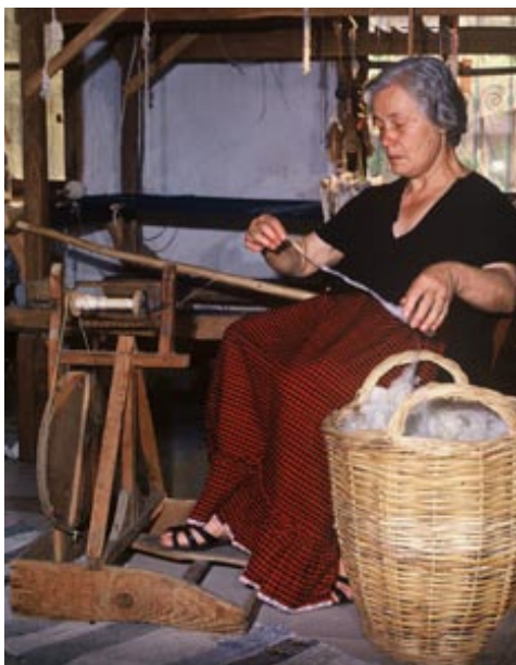
Επεξεργασία του νήματος με το τσικρίκι.

οι χρυσαηλίδες, μεταμορφωμένες πλέον σε πεταλούδες, θα βγουν από τα κουκούλια για να ζευγαρώσουν «τρυπώντας» τα, δηλαδή εκκρίνοντας υγρό και κόβοντας τη συνέχεια της ίνας. Έτσι γνέθονται, δηλαδή γίνονται κλωστή στο χέρι, όπως το μαλλί και το βαμβάκι. Αυτά τα κουκούλια είναι κατάλληλα μόνο για δεύτερης ποιότητας μεταξωτό.