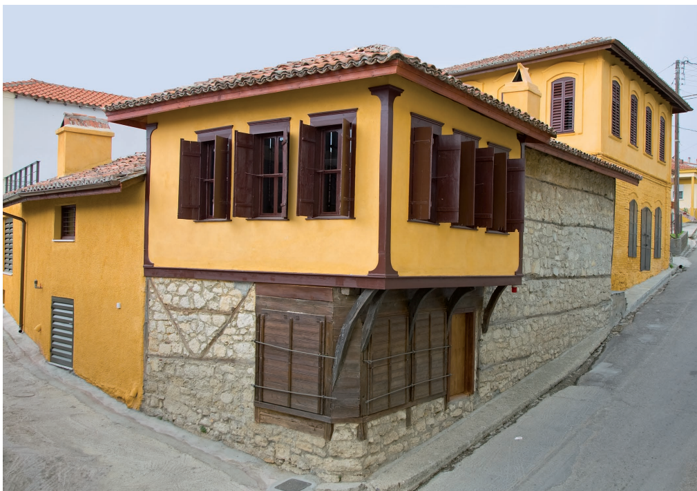
Μουσείο Μετάξης. Εξωτερική άποψη.