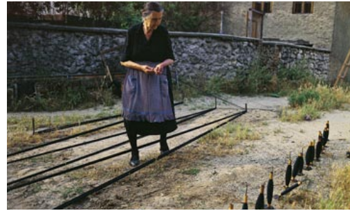
Γίδισμα: η τακτοποίηση του νήματος που θα αποτελέσει το στημόνι.

οι χρυσαηλίδες, μεταμορφωμένες πλέον σε πεταλούδες, θα βγουν από τα κουκούλια για να ζευγαρώσουν «τρυπώντας» τα, δηλαδή εκκρίνοντας υγρό και κόβοντας τη συνέχεια της ίνας. Έτσι γνέθονται, δηλαδή γίνονται κλωστή στο χέρι, όπως το μαλλί και το βαμβάκι. Αυτά τα κουκούλια είναι κατάλληλα μόνο για δεύτερης ποιότητας μεταξωτό.