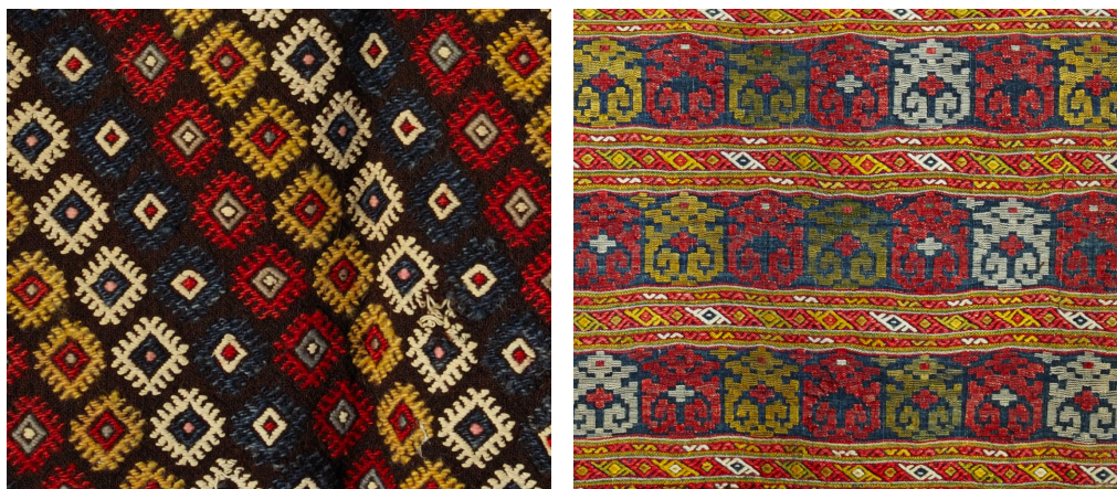
Λεπτομέρειες από μάλλινη «ποδιά με τα τσακμακάκια» (αριστερά), νυφική θυμιατή ποδιά, με στημόνι βαμβακερό και υφάδι από λεπτά χρωματιστά μετάξια (δεξιά). Μουσείο Μετάξης.

Έθιμα των νεότερων χρόνων δείχνουν τη σχέση της γυναίκας με την υφαντική: κάτω από το προσκέφαλο του νεογέννητου κοριτσιού έβαζαν ρόκα, ενώ αδράχτι και ρόκα έδιναν στη νύφη, όταν έμπαινε στο νέο σπίτι της.