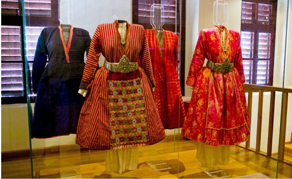
Μουσείο Μετάξης. Η προθήκη με τις τοπικές φορεσιές.

Στα νεότερα χρόνια παράγονταν υφάσματα και από εξειδικευμένα εργαστήρια, όπου εργάζονταν κυρίως άντρες, υπό την καθοδήγηση επαγγελματιικών ομάδων (συντεχνιών).